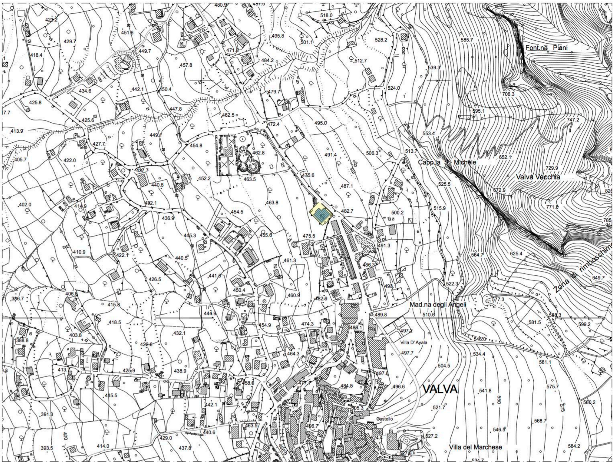
Stralcio PLANIMETRICO 1:5000