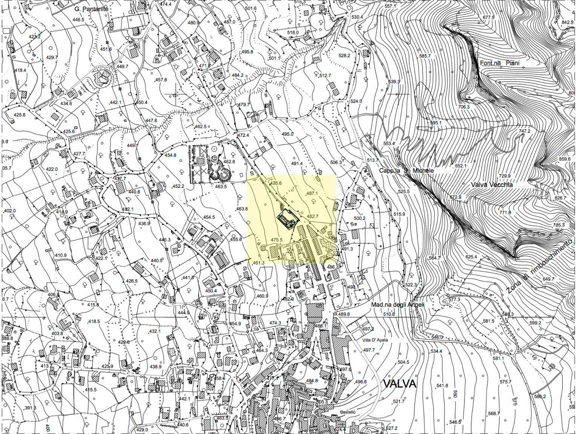
Stralcio PLANIMETRICO 1:5000